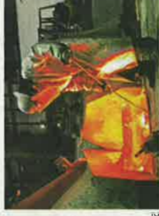
Industrie kommt wieder in Fahrt.

Die Stimmung in der deutschen Wirtschaft hellt sich weiter auf. Der wichtige Ifo-Geschäftsklimaindex stieg auf 93,9 Punkte von 92,0 im Vormonat. Befragt wurden 7.000 Unternehmen. Damit hat sich die Stimmung in Deutschland bereits den achten Monat in Folge verbessert.